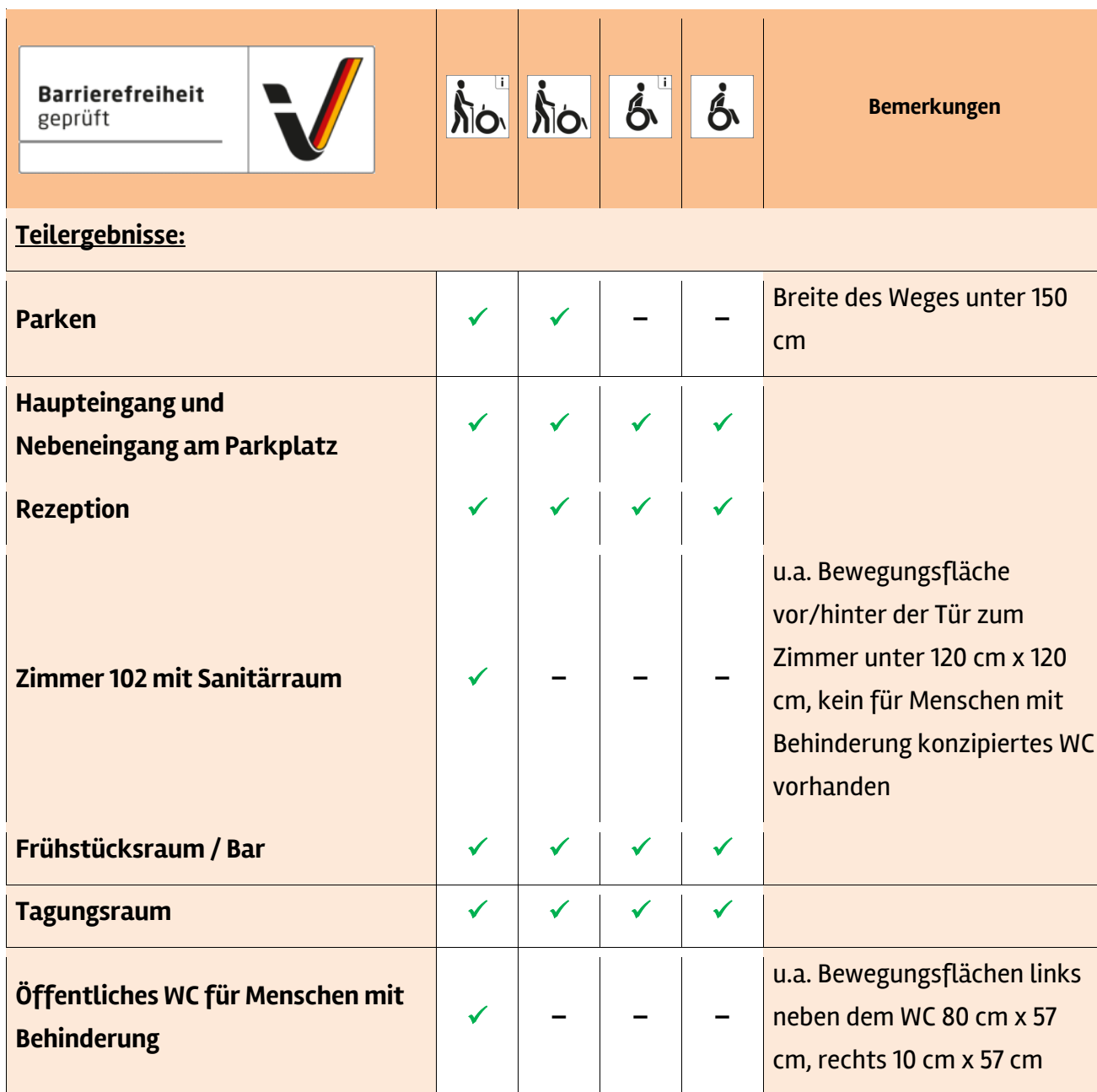
Tabelle 1: Überblick über das Prüfergebnis