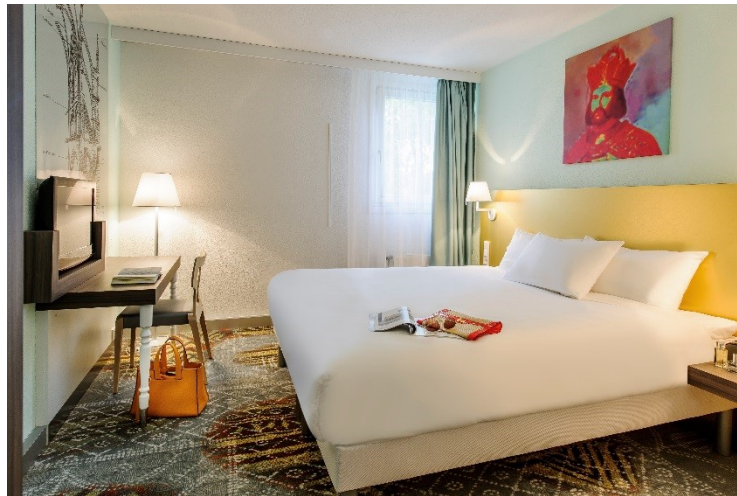
Zimmer im ibis Styles Hotel Speyer